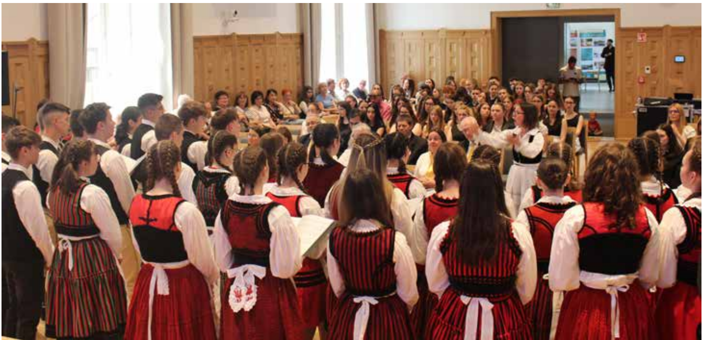
A székelyudvarhelyi Baczkamadarasi Kis Gergely Református Kollégium kórusa

(RKK)szervezésében és anyagi támogatásával, illetve még a kezdetek-kezdetén lefektetett alapértékek iránti maradéktalan szervezői ragaszkodással: hitvallást tenni a belváros változatos forgatagában arról, ami örök: Istennek teremtményei iránti szeretetéről.