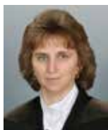
Írta és szerkesztette: Csányi Erzsébet lelkipásztor